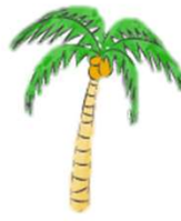
Huile de palme